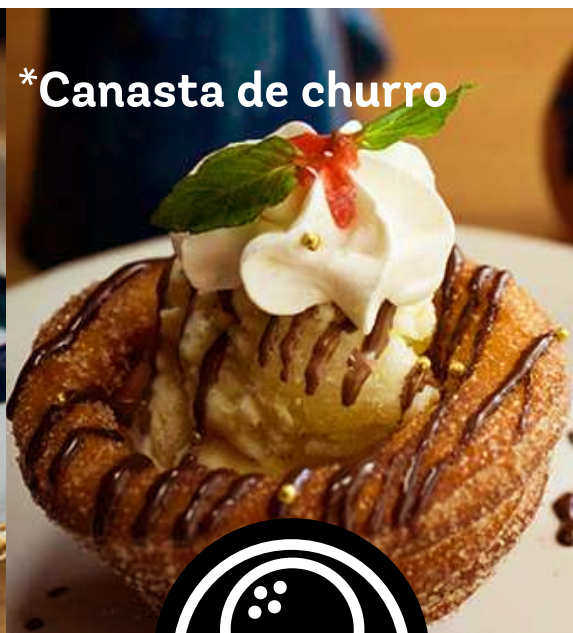
*Canasta de churro