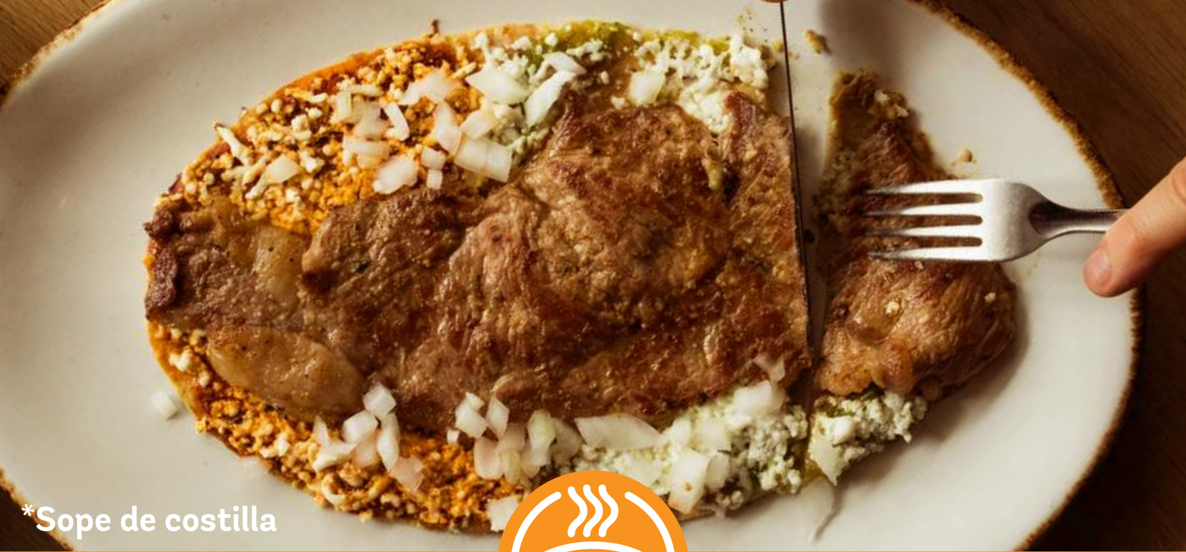
*Sope de costilla