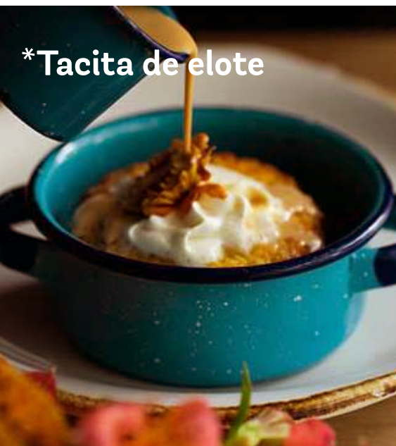
*Tacita de elote