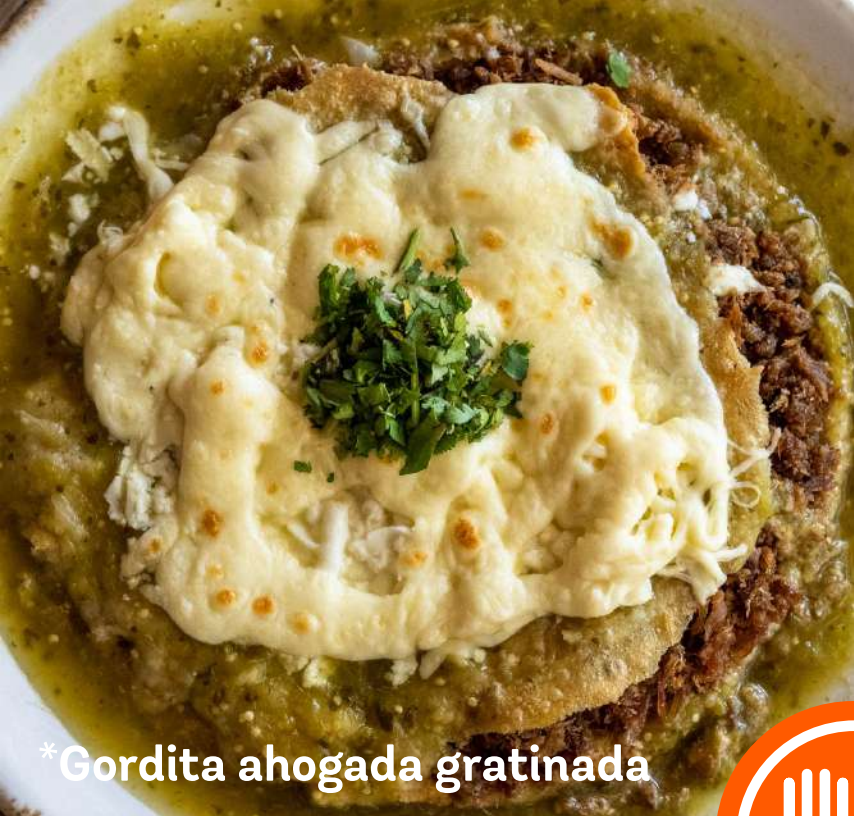
*Gordita ahogada gratinada